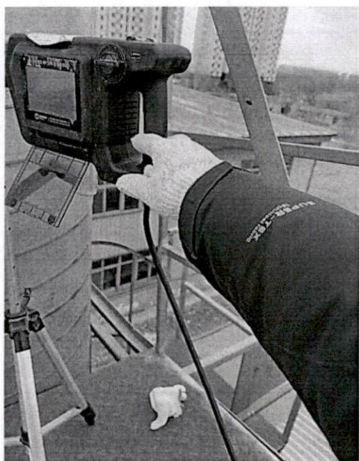
图 2-1 采样照片